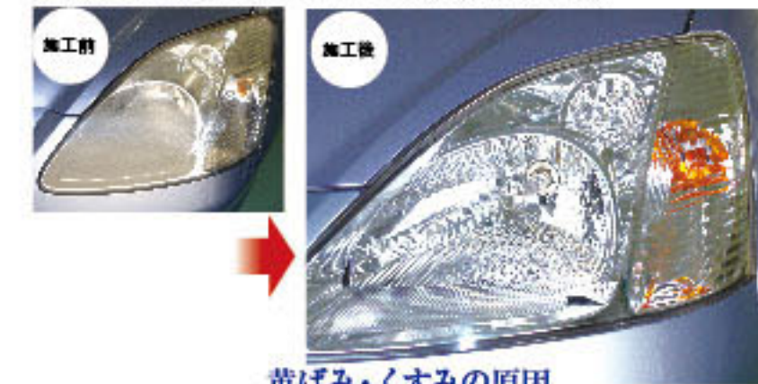
黄ばみ・くすみの原因

近年のヘッドライトは、ポリカーボネイトというプラスチック素材のレンズが使用されています。このレンズは経年劣化により、黄色く変色したり曇り等が発生します。ヘッドライトクリーン&プロテクトは、これらレンズの劣化を除去し、光沢を回復させ、さらにプロテクトガラスコーティングで強力に保護します。